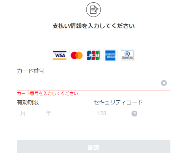
図 3-9 クレジットカード情報の入力

決済方法で「クレジットカード決済」を選択した場合、クレジットカード情報を入力します。