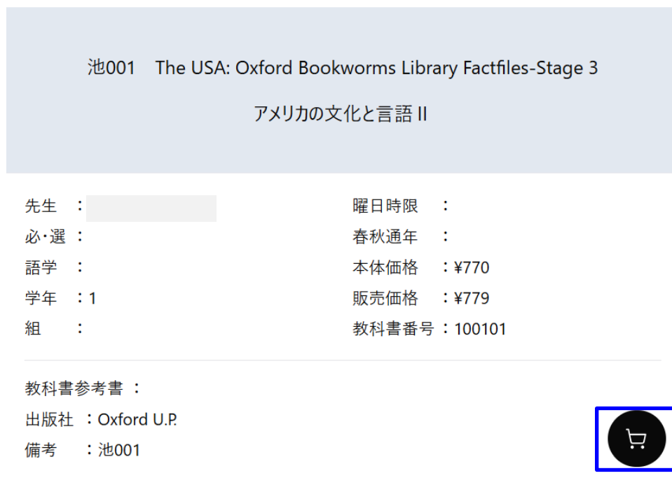
図 3-2 購入対象の商品選択

検索結果の一覧から、購入対象の商品の「カート」ボタンを押下します。 選択済みの商品は、「ゴミ箱」ボタンへと表示が変わります。 「ゴミ箱」ボタンを押下すると、購入対象から削除されます。