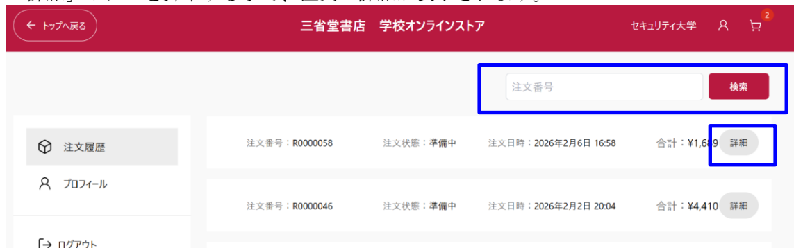
図 4-2 注文履歴一覧