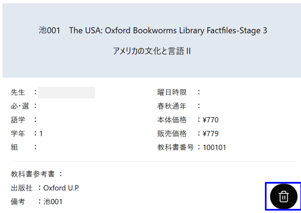
図 3-3 購入対象の商品選択状態