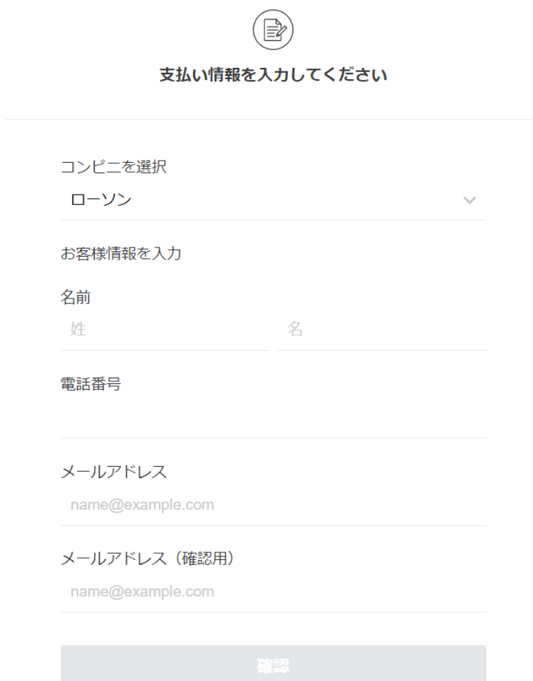
図 3-11 コンビニ払い情報入力

決済方法で「コンビニ払い」を選択した場合、コンビニ払いを行うための支払い情報を入力します。