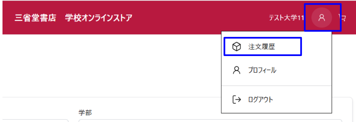
図 4-1 ヘッダーの表示