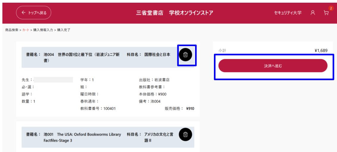
図 3-4 商品の選択完了