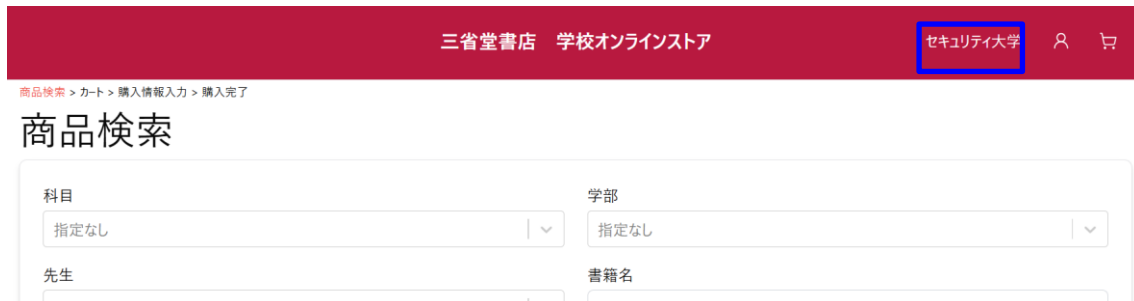
図 2-1 ログイン後画面

三省堂書店 学校オンラインストアにログインすると、「商品検索」画面が表示されます。ログインした際、右上に所属している学校名が表示されることを確認してください。